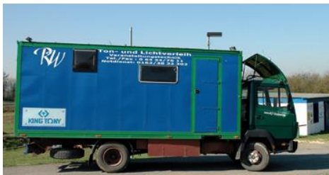
Der LKW als Werkstattwagen

Im Laufe der Jahre wurde ein Vereins - LKW angeschafft, mit dem die Jugendlichen auf die Rennen gezogen wurden. Der als Werkstatt umgebaute 7,5 Tonne hatte alle Gerätschaften an Bord, die zur Reparatur der Rennfahrzeuge nötig waren. Gleichzeitig wurde er auch als Wohnmobil genutzt