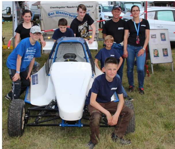
Das Crosskartteam auf dem Heimrennen in Dauborn