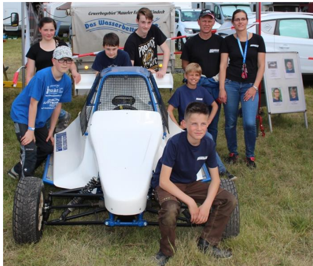
Das Crosskartteam auf dem Heimrennen in Dauborn 2019

Aufgrund der Corona bedingten Pause im Autocrosssport kam es nur zu wenig Einsätzen des Karts. Bei einem Unfall beim Heimrennen 2021 wurde das Kart stark beschädigt und musste verkauft werden.