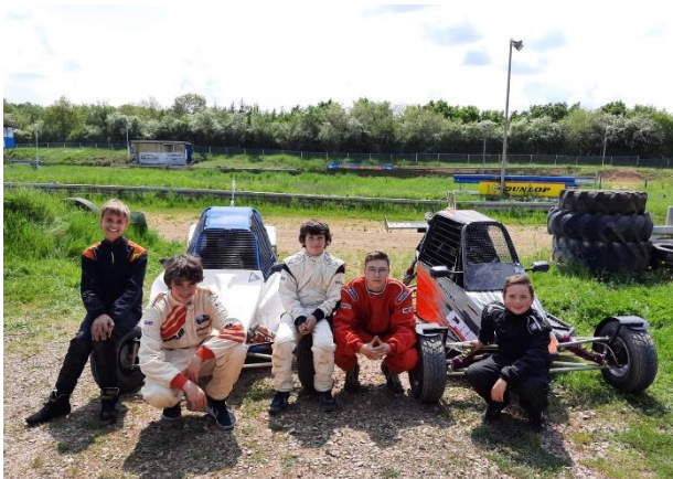
Crosskartteam vor der Saison 2022.

Mit Unterstützung des Vereins und der großzügigen Sponsoren wurde für die Saison 2022 ein größeres, gebrauchtes Crosskart der Fa. Peters Autosport angeschafft. Da viele der Jugendlichen stark gewachsen waren hatten nun alle wieder Platz hinter dem Lenkrad. Die erste richtige Saison für die Kartgruppe war ein voller Erfolg. Fünf von acht Rennen konnten die Dauborner Youngster gewinnen und somit den Meistertitel in der Klasse ab 11 Jahren beim DRCV einfahren und das als punktbestes Team aller DRCV