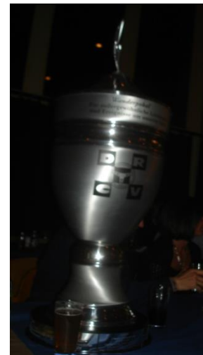
Wanderpokal für besondere Leistungen

Auch der Deutsche Rally Cross Verband (DRCV) unterstützte die Jugendarbeit und richtete eine zweite Jugendklasse ein, in der die Jugendlichen von 14 bis 16 Jahren teilnehmen dürfen. Später kam dann noch die Klasse der Juniorbuggys zustande, in der die Jugendlichen ab 16 Jahre schon in Eigenbauten mit 600ccm Motorradmotoren starten dürfen. Im Rahmen dieser Klasse konnten die jungen Talente ein Jahr später schon an den Cupläufen der Erwachsenen teilnehmen.