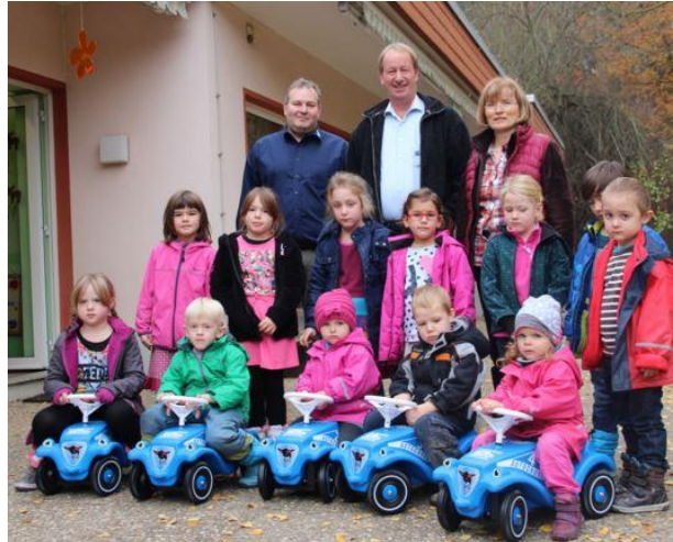
Bobbycarspende für den Dauborner Kindergarten

Das Auto Cross Team Dauborn möchte auch Kinder durch geeignete Maßnahmen behutsam an den Motorsport heranführen. Zu diesem Zweck wurden im Sommer 2015 mehrere Bobby Cars in der Vereinsfarbe gekauft und mit dem Vereinslogo und Startnummern beklebt. Der örtliche Kindergarten freute sich über die Spende. Auch wird seit mehreren Jahren das Kinder- und Jugendheim Funk GmbH aus Runkel zu unserem Rennen auf dem Dauborring eingeladen.